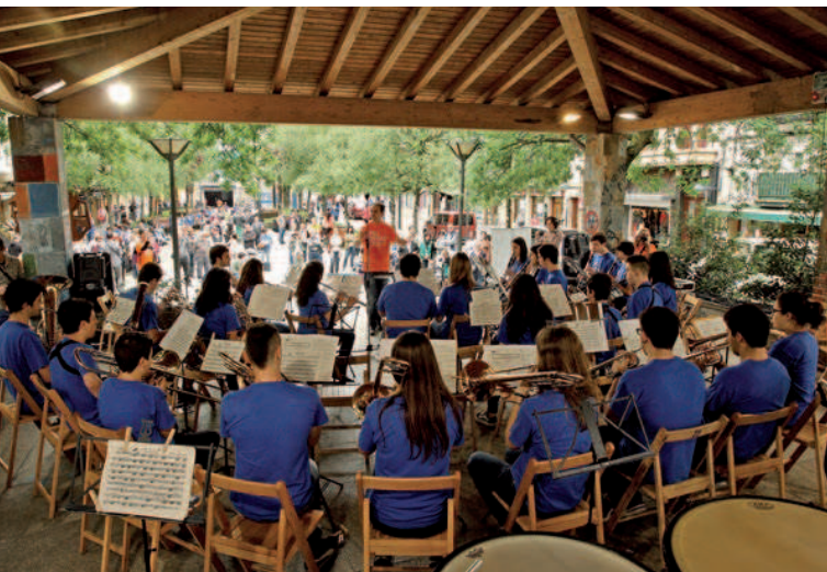
Banda de Errenteria Musikal en el Musikaldia 2015.

continuó por la tarde, a partir de las 19 horas y hasta las 21, en que las diversas agrupaciones musicales y de danza de Errenteria (Kukai, Andra Mari, Landarbaso, Ereintza, Amulleta y Kantujira) contribuyeron a redondear un magnífico día de música. A primera hora de la tarde se celebró en el estadio de Anoeta de Donostia el ensayo para el E-Musik previsto dentro de la capitalidad cultural Donostia 2016, aprovechando la celebración en Errenteria del Musikaldia. Lo malo es que al día siguiente la noticia en la prensa la copaba el ensayo y no las múltiples actuaciones que se desarrollaron en Errenteria. Creemos que en calidad, esfuerzo, variedad y resultados la noticia debiera haber sido la jornada de Errenteria. Ojalá el año que viene el E-musik consiga de los medios de comunicación y la organización una mejor focalización de la noticia.