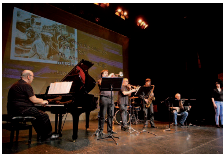
Profesorado de Errenteria Musikal en el concierto didáctico de Musikaste.

Las líneas habituales de programación de Musikaste son el apoyo a la música contemporánea, recuerdo de los compositores en sus efemérides y apoyo a los nuevos valores en la interpretación. El próximo año 2016 conmemoraremos los centenarios de los siguientes compositores: