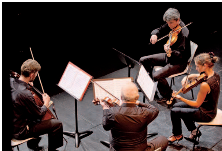
Quatuor Arnaga interpretando a José M a Usandizaga.