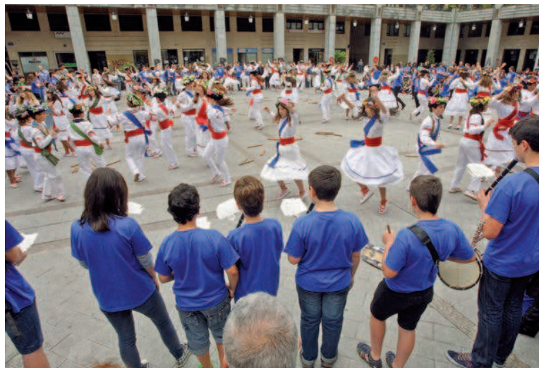
Dantzaris de Errenteria Musikal en el Musikaldia 2015.