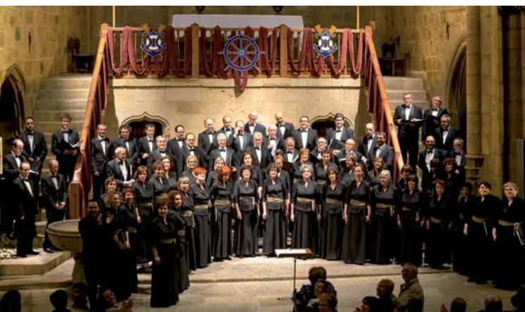
7 de mayo de 2016. Getaria. Último concierto dado hasta la fecha.

incluían obras de ambos compositores y en la que destaca el Poema de la Pasión de Aita Donostia.