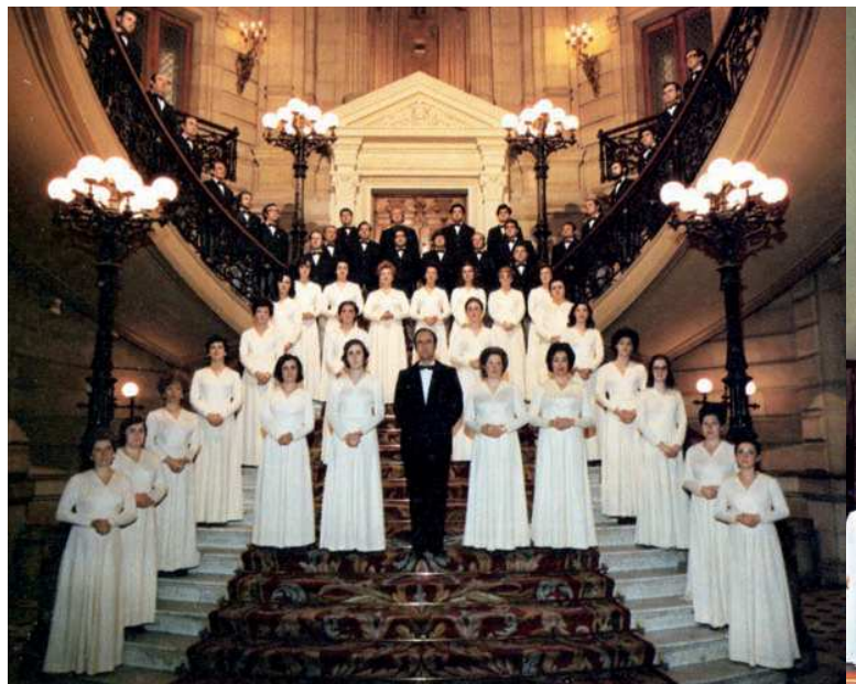
Andra Mari 1975 Ayto. Donostia – San Sebastian

Lehenengo saio hartan izandako arrakastak beste erronka bat hartzera bultzatu zituen: Ereintza elkar-teak antolatutako Gabon-kanten lehiaketan parte hartu zuten 1966ko abenduaren 31n. Coro Parroquial de Nuestra Señora de Fátimaizenez kantatu zuten Jasokundeko elizaren atariko eskaileretan. Eta zer egingo, eta, irabazi! Lortutakoak animaturik, tal-