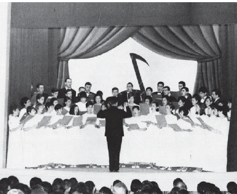
Actuación en el cine Alameda en 1967. Director: José Luis Ansorena

El 12 de noviembre de ese mismo año tuvo lugar la inauguración y bendición del nuevo edificio y en esta ceremonia actuó un grupo de feligreses junto a un grupo de cantores veteranos provenientes de la Parroquia Matriz de Errenteria, dirigidos por José Luis Ansorena.