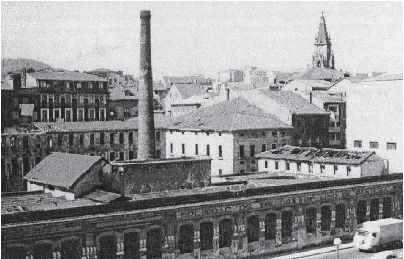
Linoko Ehun lantegia, Nafarroa hiribidetik ikusita. (EUA A011F001)

tegien arrastorik mantendu ez duen hirigintzarako pausoa eman da. Plaza eta auzoen izenak gogora ekarri nahi dituzte garai horiek, baita tente dauden tximinia bat edo bestek ere. Errealitatea, ordea, bestelakoa da. Egungo herritarrak industrializazioaren seme eta biloba sentitu daitezkeen arren, datozen belaunaldietan ez da sentimendu hau mantenduko transmititzen jakiten ez bada. Bisita honekin, herriarentzat horren garrantzitsua izan zen industrializazioa ezagutzeko aukera eman nahi du Udalak. Industrializazioaren hastapenetatik Gerra Zibila piztu bitarteko Erreneriara gerturatzeko proposamena da. Manchester txikira bidaiatzekoa, hain zuzen.