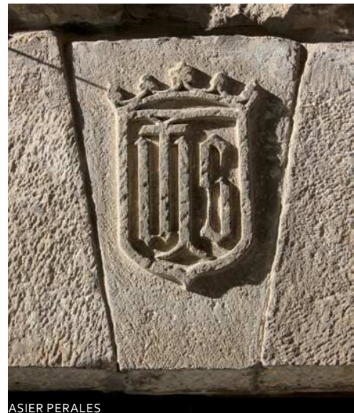
Erdi Aroko armarria Santxoenea kaleko 28. zenbakiaren ondoan. (EUA A090F105)

deak izan dira, baita ere, 2015etik Udalak eskaintzen zituen bisitetako gida lanak egin dituztenak.