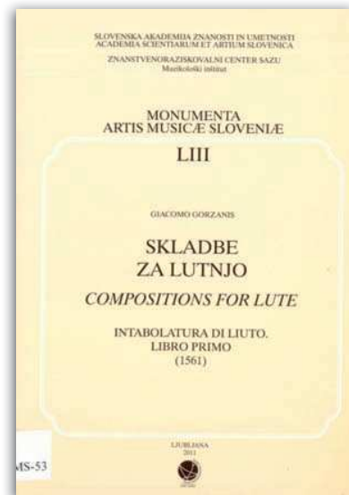
Volumen de partituras musicales en intercambio con Eslovenia.