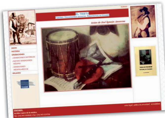
Página web dedicada al txistu