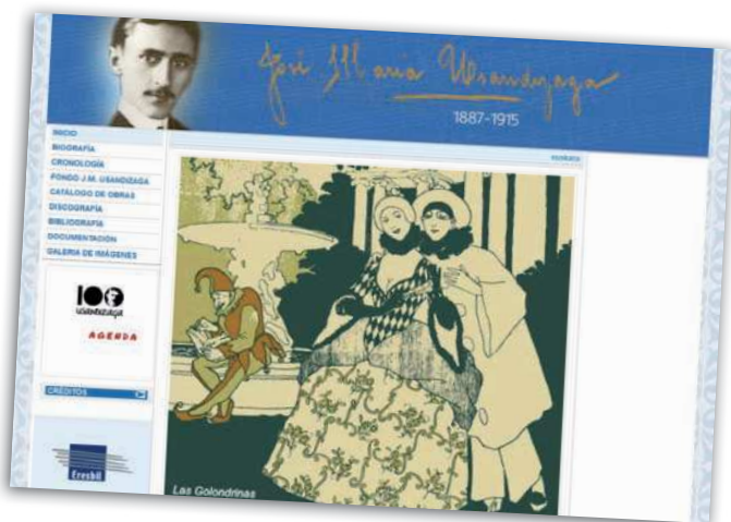
Página web dedicada a José M a Usandizaga

familiar que contiene el fondo del compositor, destaca el apartado de documentación con gran cantidad de recortes de prensa de la época. La página está consultable en la dirección: http://www.eresbil.com/web/usandizaga/ .