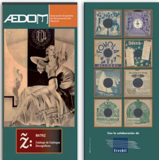
Folleto del catálogo online de catálogos discográficos anteriores a 1954.