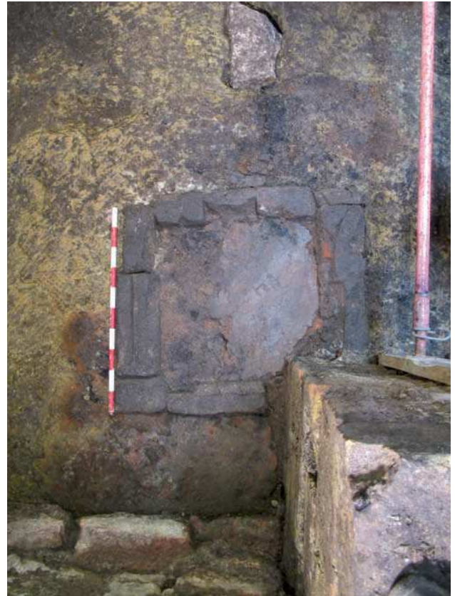
Labearen plakaren xehetasun bat.

batzuetan zirkulu-formako edo angeluzuzeneko oinplanoa dute). Barrualdean suaren eraginez gogortutako buztin plaka bat izaten dute, zolata bezala erabiltzen zena. Sutondo hauek etxerako ziren, hau da, janaria prestatzeko, gelak berotzeko edo argitzeko erabilitako sua zaintzeko eginak zeuden. Egitura xume hauek ez zuten estalirik eta sua zaintzen zuten inguruko harrizko hormatxo horien bitartez. Sutondo hauek lurrean jartzen ziren, eta bertan edo belauniko edo banku baxu batean eserita egiten zuten lan. Bere ezaugarriak zirela eta, txabolen edo etxeen erdialdean kokatzen zuten sute arriskua saihestearren, gehienbat kontuan izanda egitura hauek material begetalekin egiten zituztela (egurra, adarrak, lastoa).