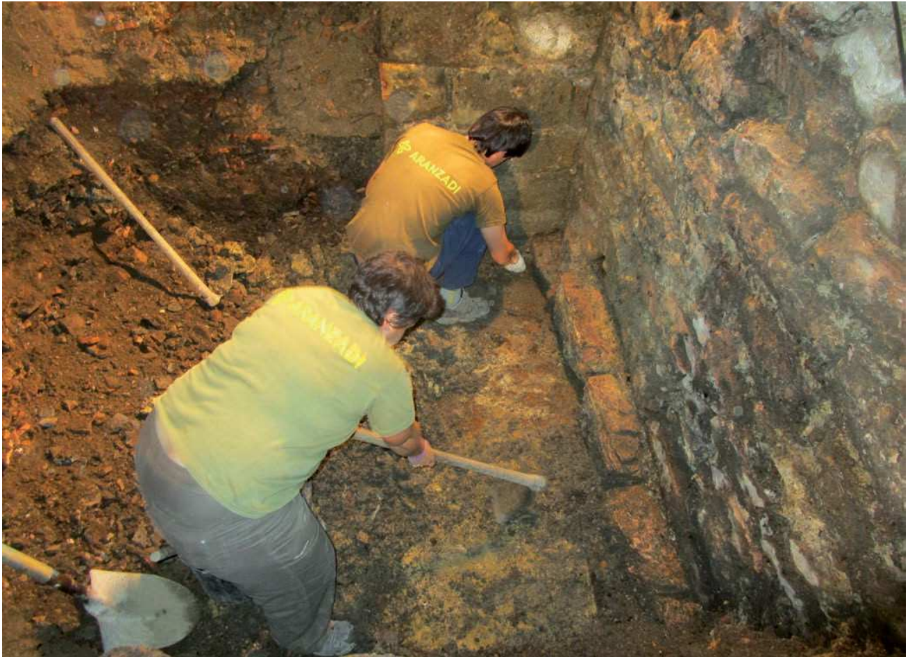
Arkeologia-lanen garapena balorazio-ikerketan.