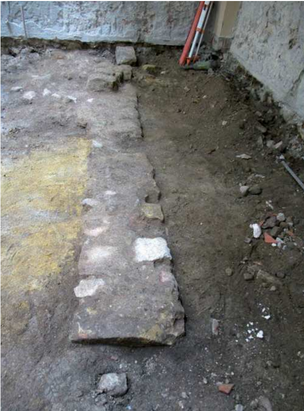
Ixteko atzeko hormaren ikuspegia.