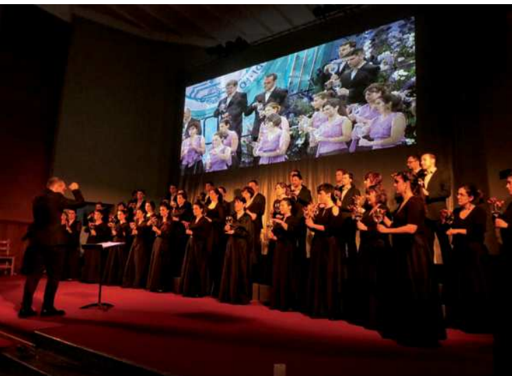
Otra imagen de Landarbaso munduan.

Un concierto de este tipo requiere de una gran preparación y calcular los tiempos suele ser fundamental. Y como siempre, alrededor del montaje suceden vicisitudes y anécdotas.