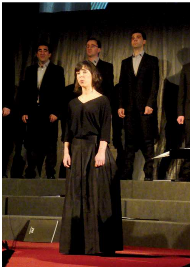
Landarbaso munduan. 24-04-2016.

En el concierto también se vislumbró un trabajo a futuro muy interesante. Nos estamos refiriendo a los corralistas jóvenes que han crecido en número y que en las actuaciones se fusionan con los veteranos, lo que nos promete una continuidad y desarrollo muy interesante, que habrá que seguir con atención.