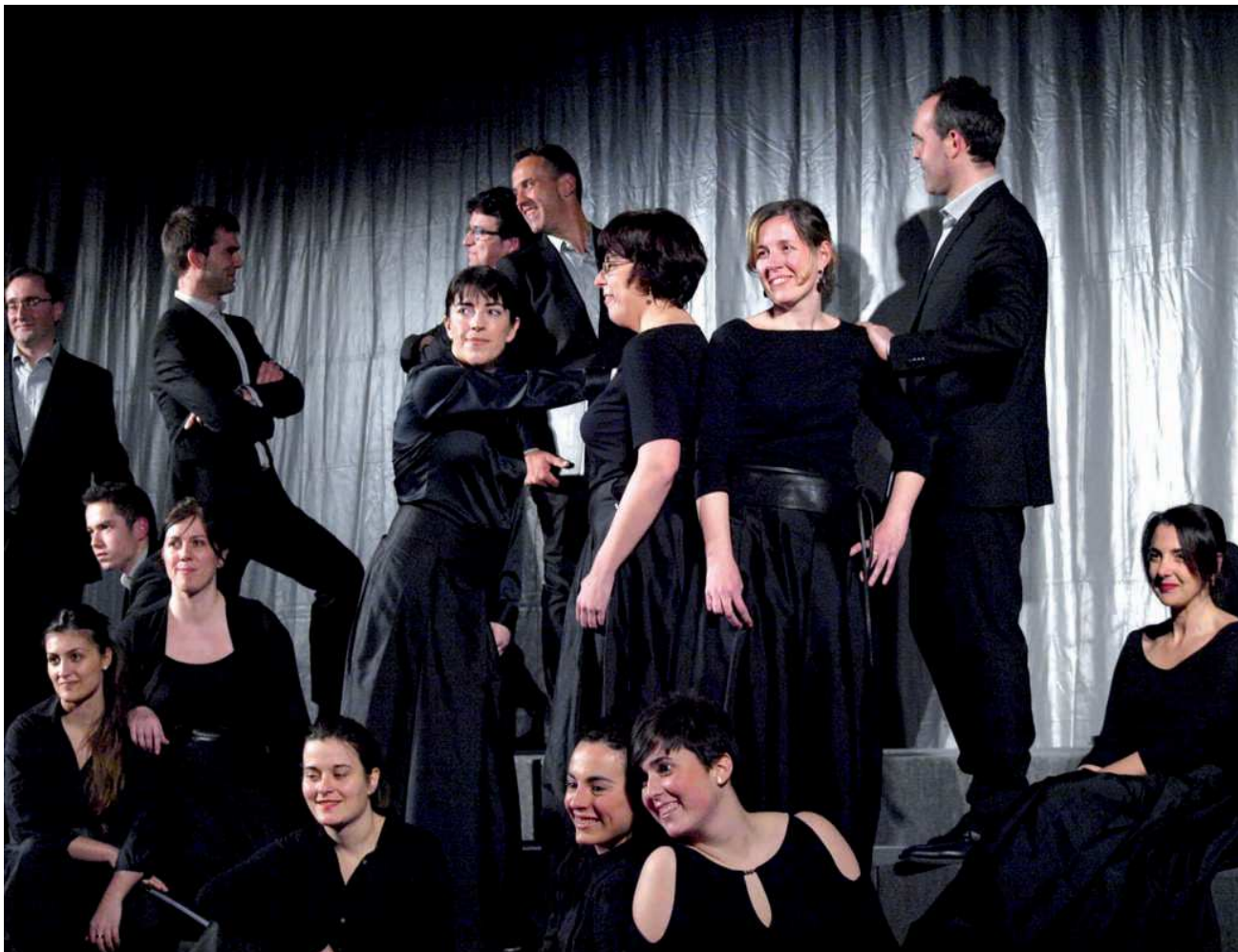
Landarbaso munduan. Concierto en la parroquia de Nuestra Señora de Fátima.