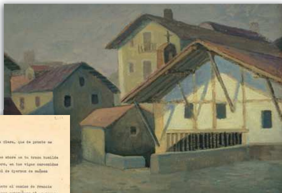
Santa Klarako ermita. Olioa tablexean. 49x64 cm.