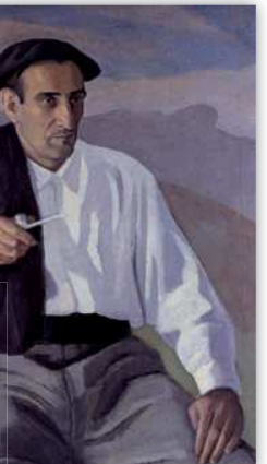
Xenpelar, 1968. Olioa mihisean. 100x81,5 cm