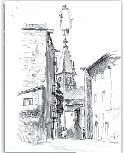
Goikokale. Arkatza eta luma paperean. 26x20 cm.