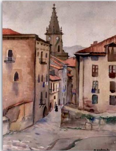
Goikokale. Akuarela. 63x49 cm.