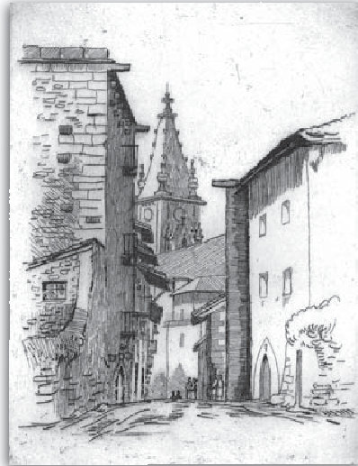
Goikokale. Luma paperean. 46x36 cm.