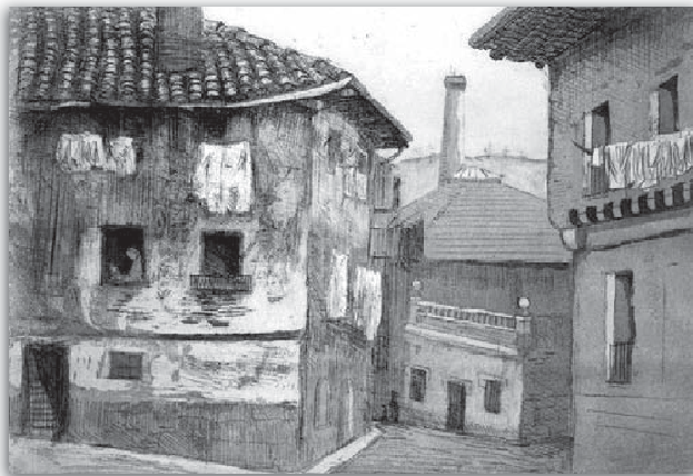
Orereta kalea. Aguafurtea. 30x25 cm.