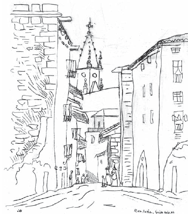
Goikokale. Litografia. 30x23 cm.

Antonio Valverde Ayalde, bere osotasunean, izan da erakusketa honetan azaltzen ahalegindu garena eta hemen bildu dugu honen guztiaren testigantza grafikoa.