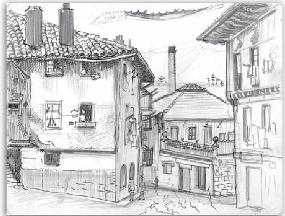
Orereta kalea. Arkatza eta luma paperean. 20x25 cm.