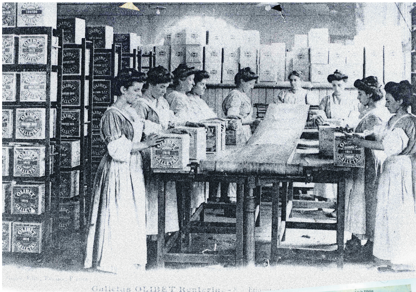
Galletas OLIBET Renteria - Vista general de la Fábrica