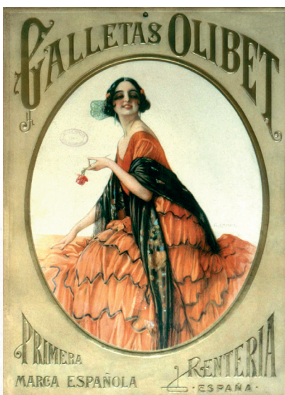
Olibet gailera kartel iragarkia. EUA A081F066.

Abaltzisketan .....Txahalburuk Albizturren.....Kunplituak Alegin.....Txintxarrik Alkizan.....Oiloak Altzagan .....Zakurrak Altzon .....Tipulek Amezketan.....Elbik