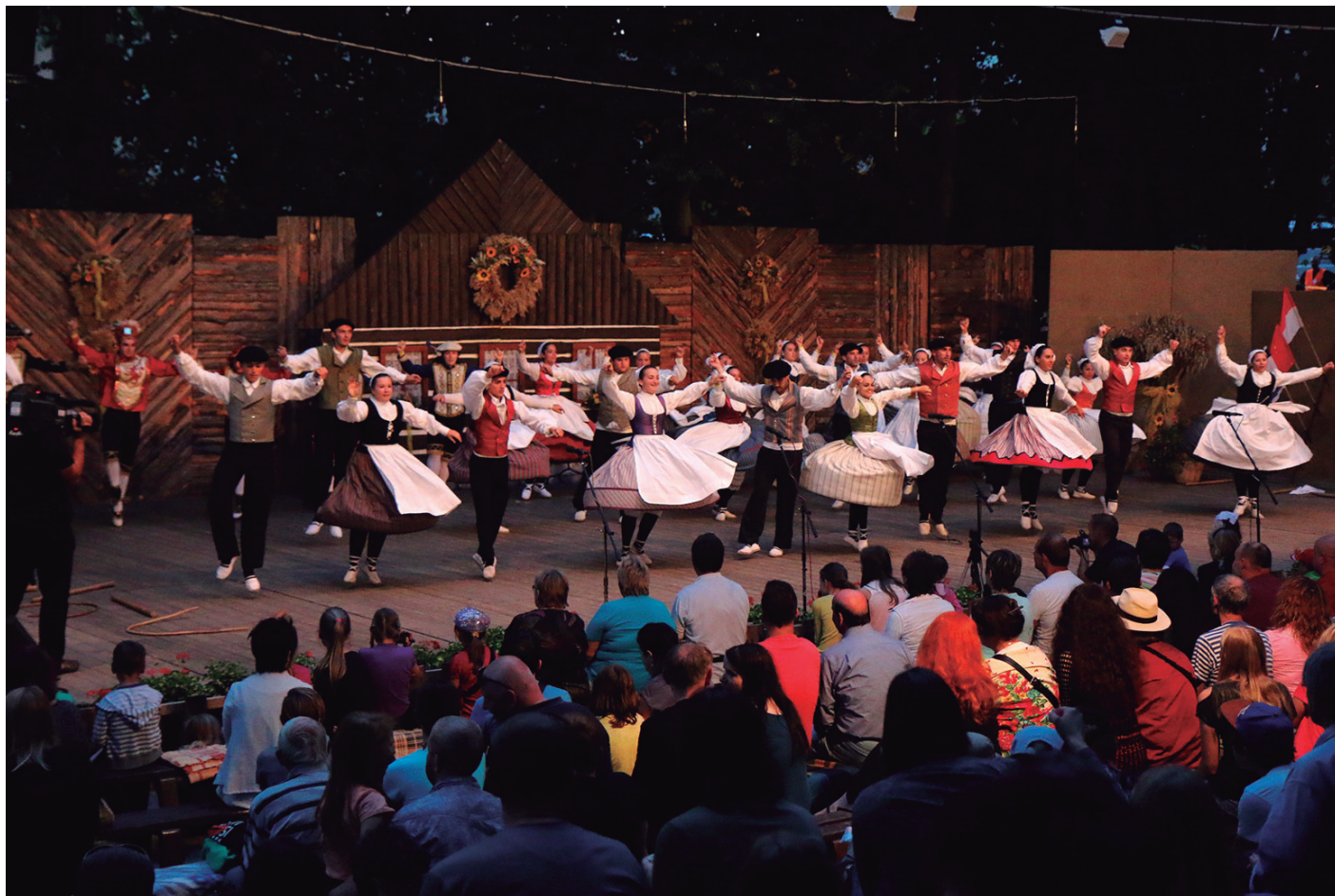
Mezinárodního folklorního festival

kultura eta dantzak partekatzeko aukera izan genuen (hots, amerikarrak gu "claqué"-a dantzatzen jartzen saiatu zirenean, batzuen abilezia faltak eragin zuen porrota). Gau aberasgarria benetan.