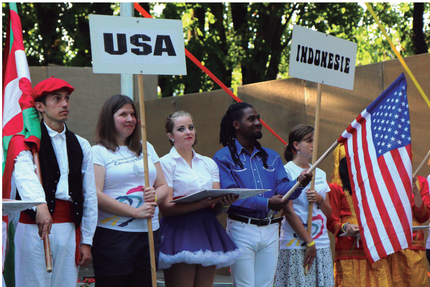
Mezinárodního folklorního festival

eskaini zituen; aipagarria da gure kulturak eta dantzek bai txekiarren, baita beste dantza taldeengan ere izan zuten harrera ona.