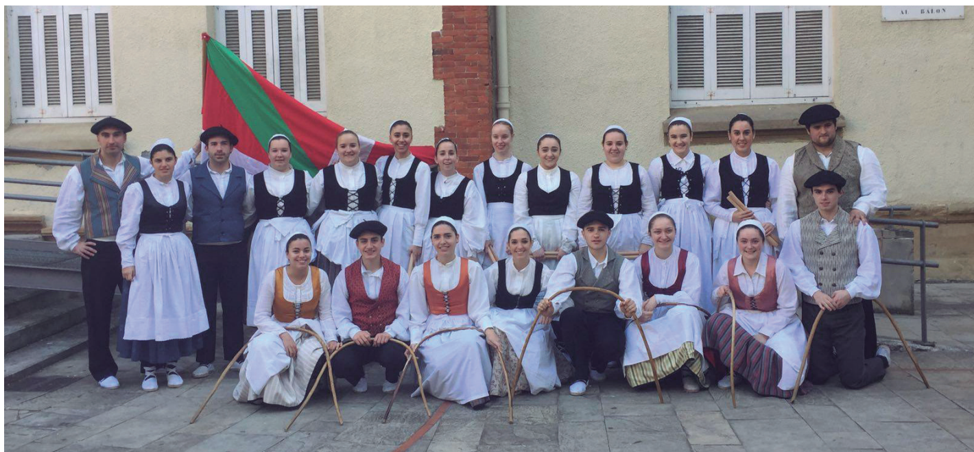
Ereintza Dantza Taldea