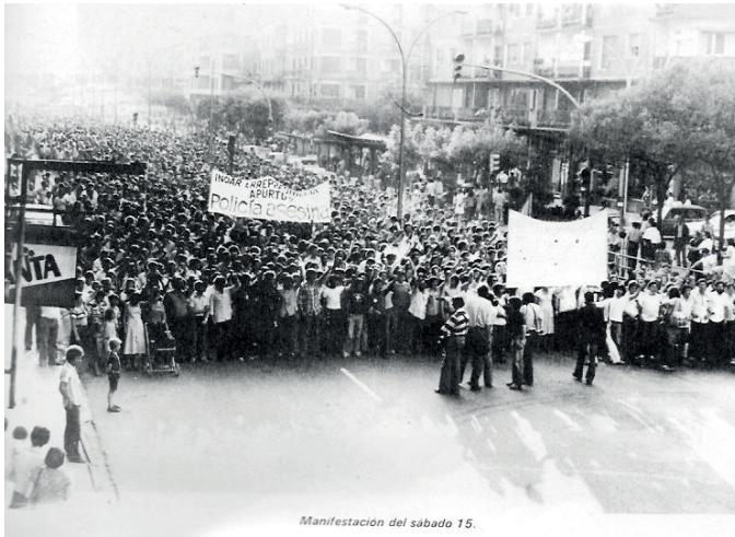
Manifestación del sábado 15.