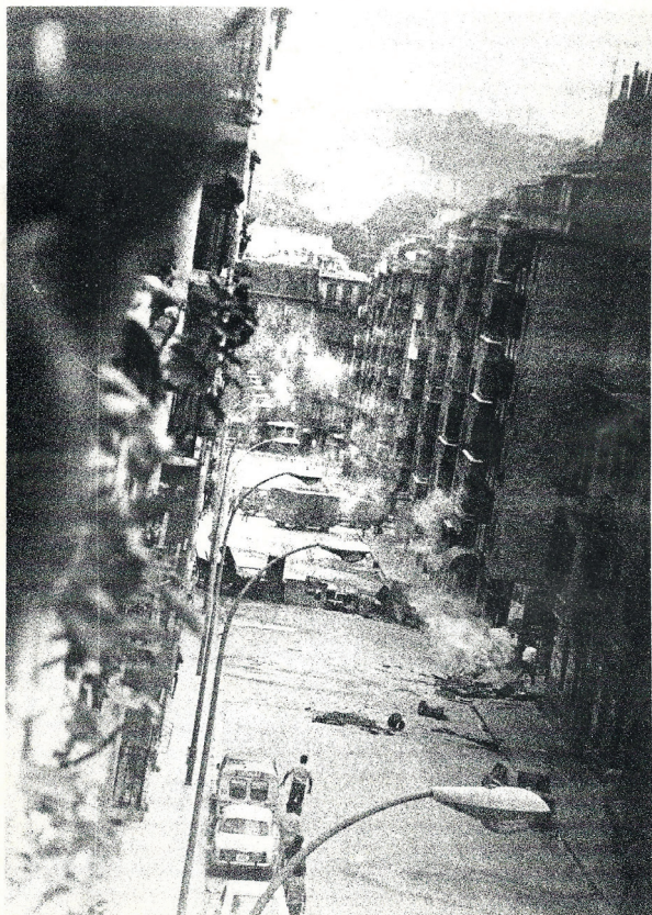
Biteri kalea. Errenteria.

zuzendaritzaren partaide batek hitza eskatu du, papera amaitu egin zaiela eta Papelera Españolatik hartzeko baimena eskatuz.