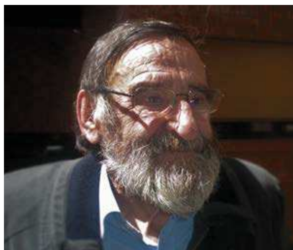
'Matxio'.