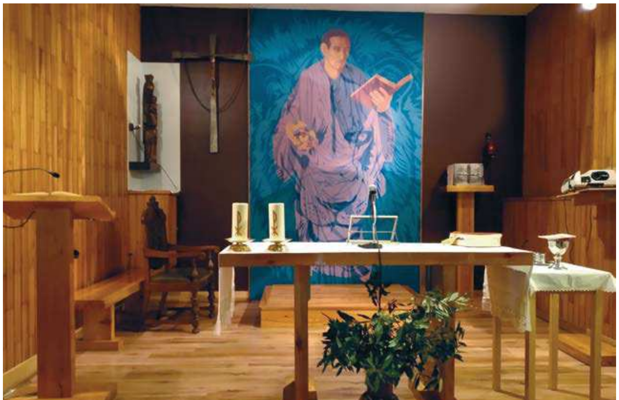
San Marko eliza. Pontikako auzoa.