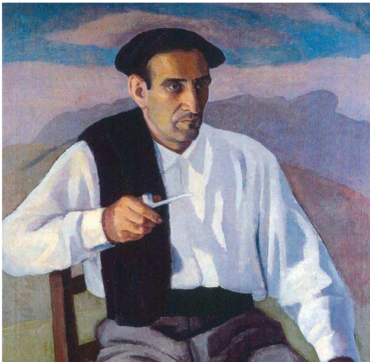
Egilea: Antonio Valverde "Ayalde"

Ofizialki existitzen den herria, la "Muy noble y muy leal, villa de...." baita.