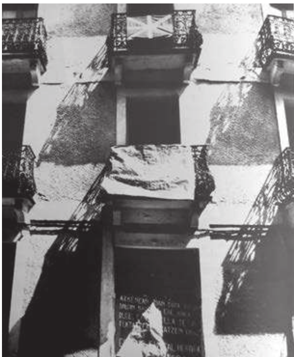
Guardia Zibilaren kuartel zaharra.

XIX. mendeko mikeleteen antzera, Aitorren leinuko polizi berria, mamutzar berdeak baino dotoreago jantzen ziren eta azkarragoak ziren jendea kontrolatzen.