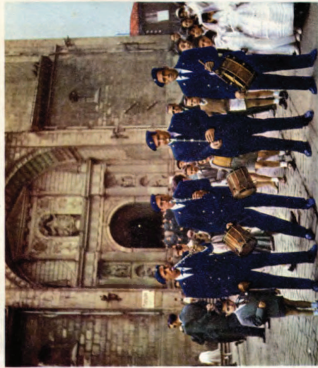
Domingo de concherto