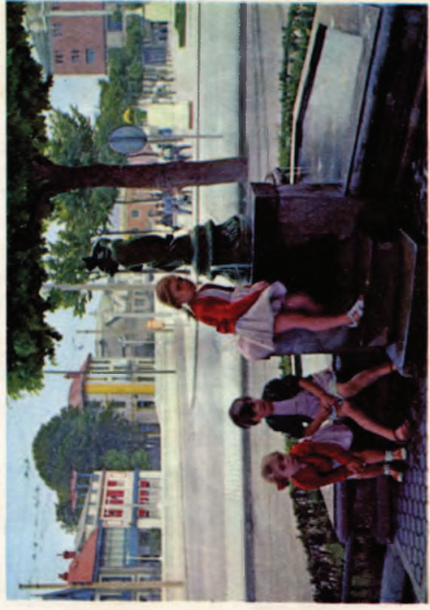
Fuente de la Alameda