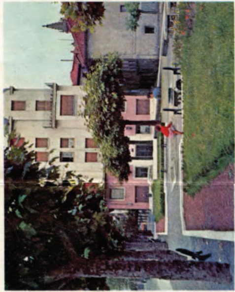
Jardin junto a las escuelas de Viteri