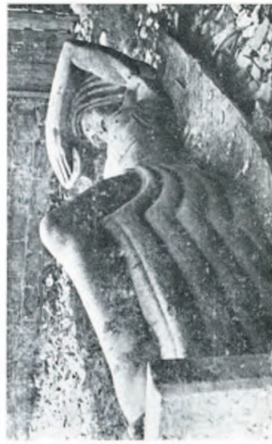
Lamentable estado actual de la obra en su injusto exilio.

El pueblo estaba dividido en partidarios y en contrarios de la dichosa estatua. Por fin se llegó a colocar el monu-