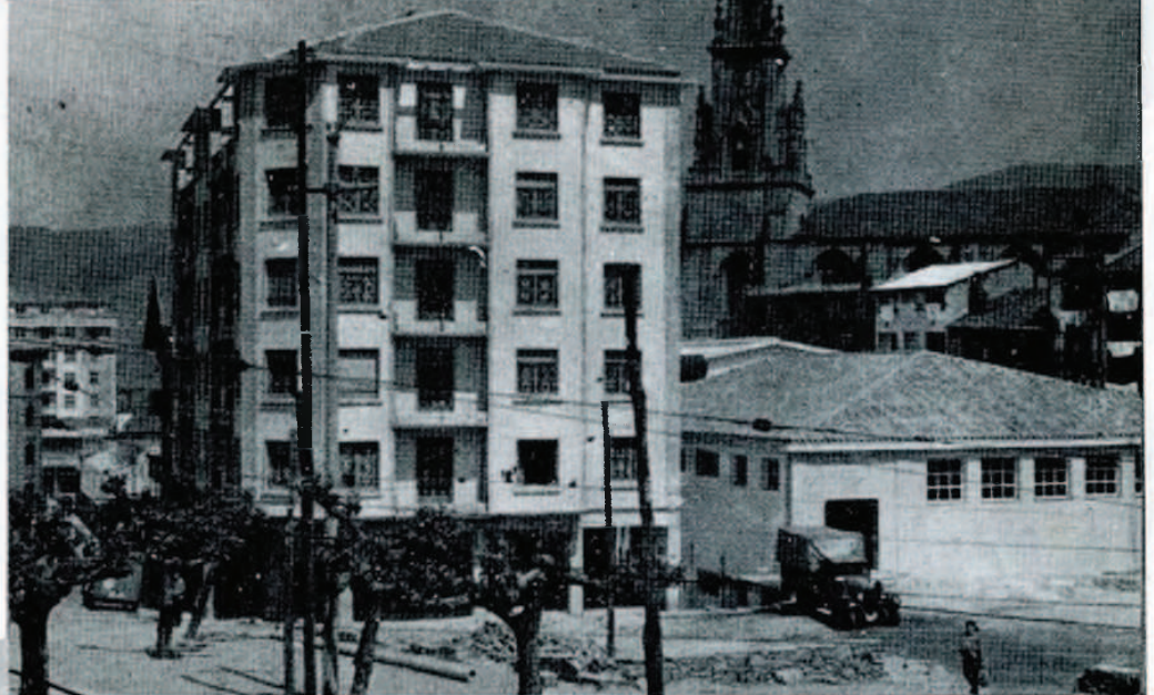
Bajada de la Estación del F. C. de la Frontera