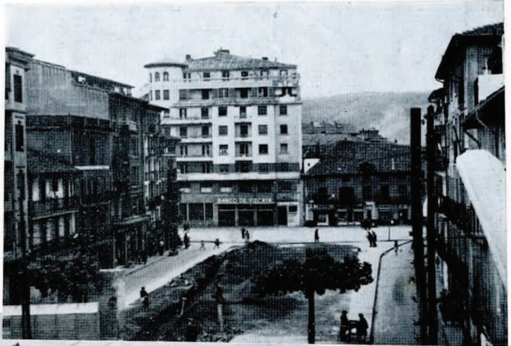
La Plaza de los Fueros en la actualidad, después del derribo del viejo Mercado.