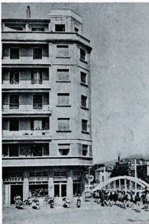
Desde el puente de Santa Clara. - A la izquierda lugar donde estuvo emplazada la Ermita de la Santa.