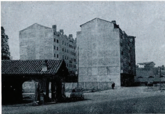
Barrio de Gavlerrota — Ensanche.