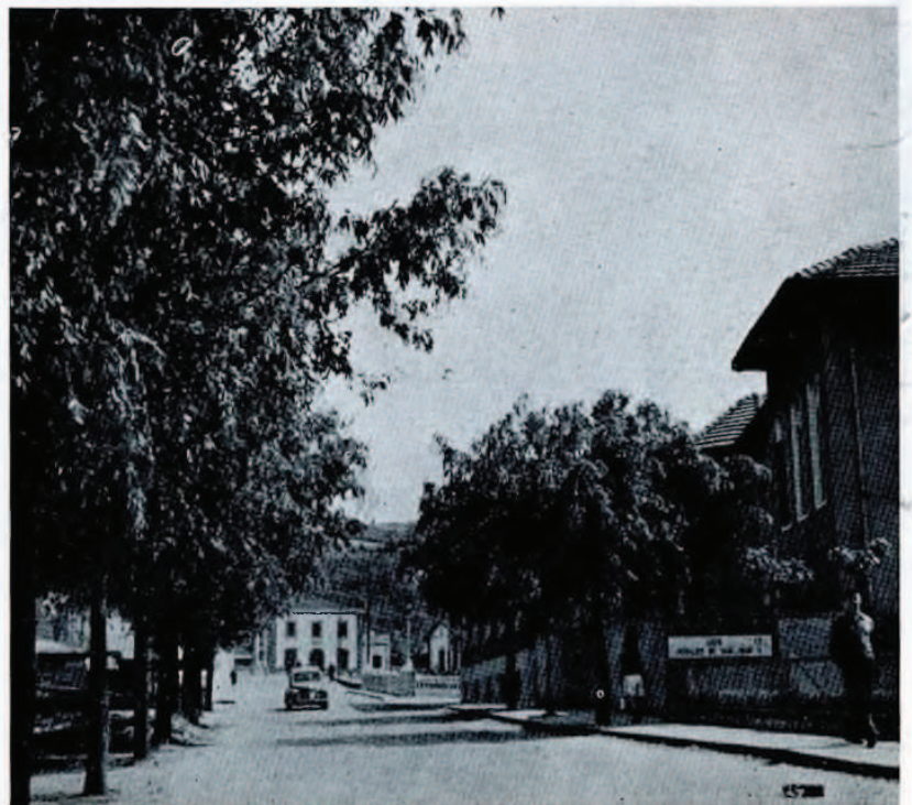
Nueva carretera a la estación del F. C. del Norte,