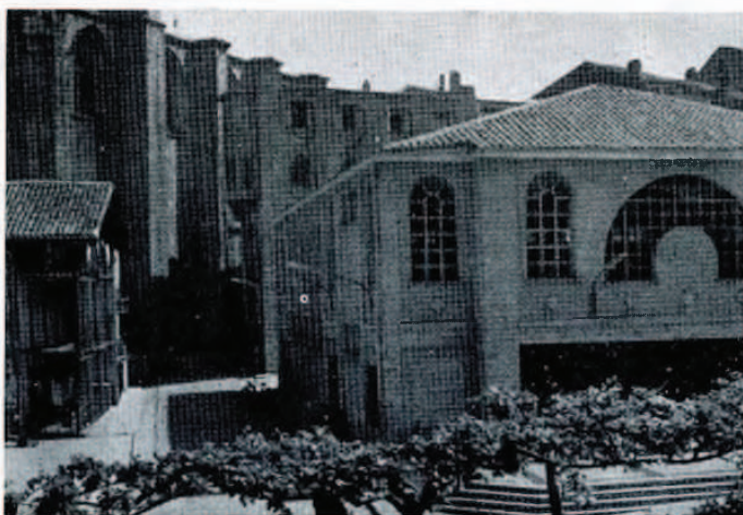
Entrada a la nueva Plaza del Mercado.