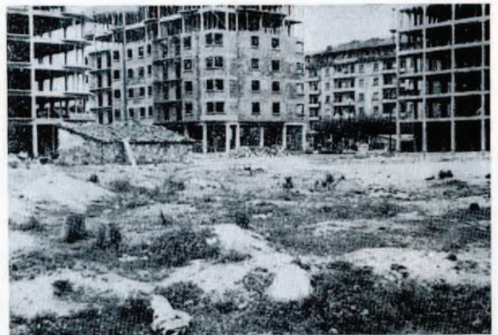
Terrenos de Iztieta.