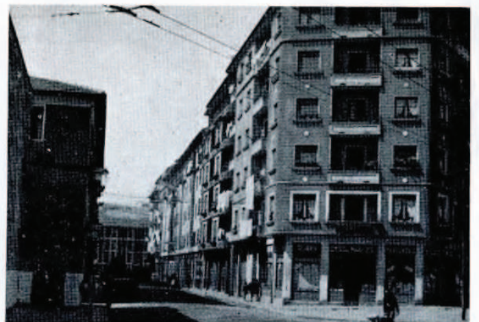
Calle de Alfonso XI.