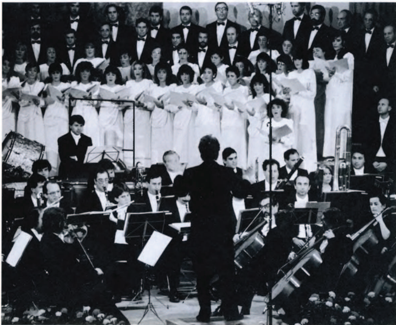
La Coral Andra Mari y la Orquesta de Euskadi interpretan "La Victoire de Guernica" de Luigi Nono.