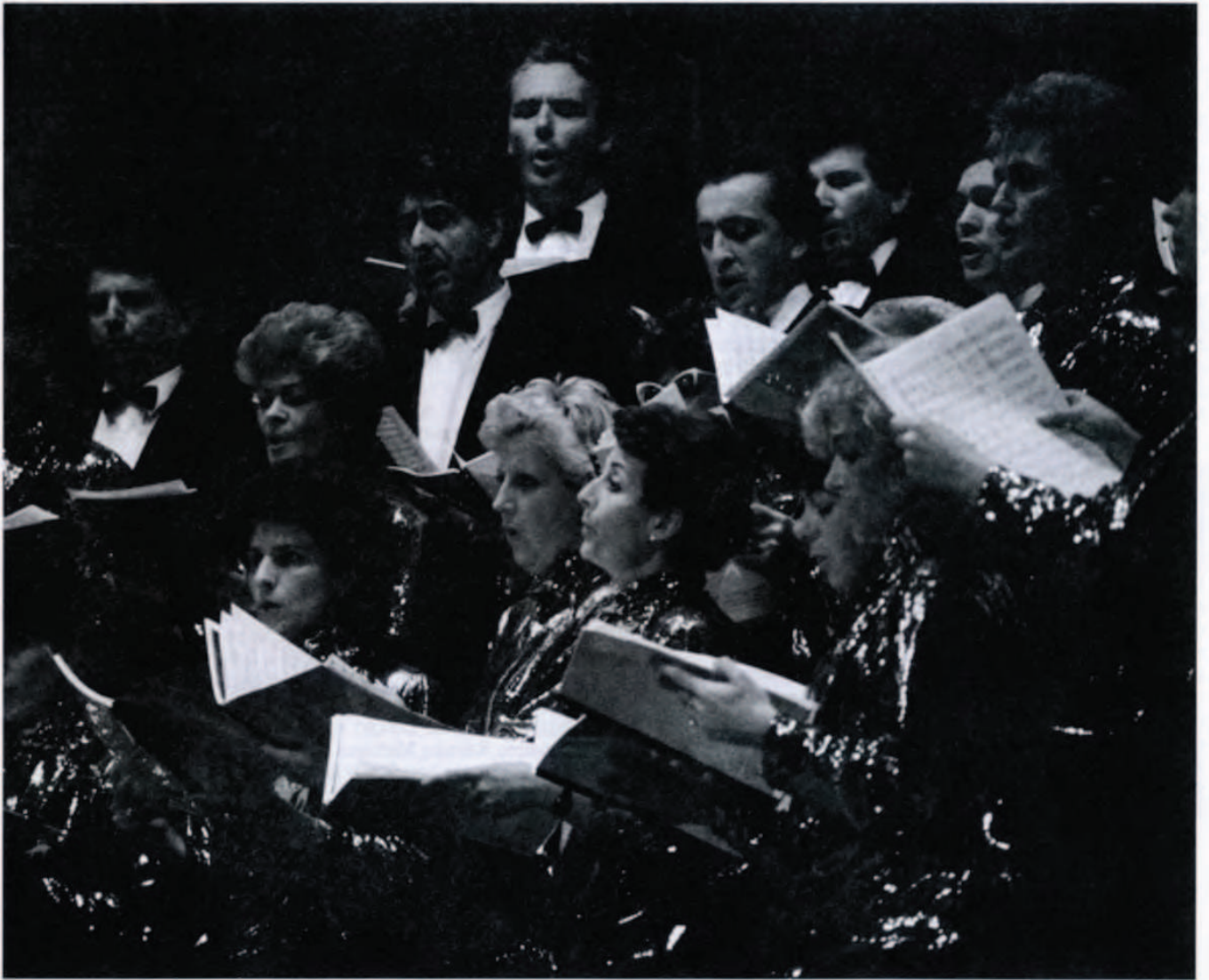
Presentación del "Choeur du Pays Basque" de Bayona.

en lugar destacado y junto a los intérpretes, un caluroso aplauso de todos los presentes. En cierto modo, José M.º Usandizaga se hizo un poco presente entre nosotros. Todos le recordamos con una mezcla de cariño, admiración y pena.