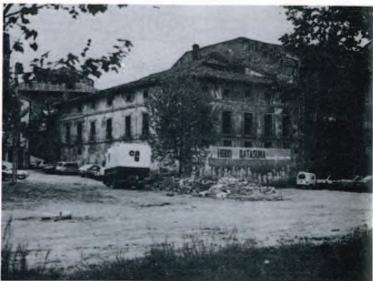
Casa de la Fábrica de Lino en la que se levantaba la torre de la entrada de Fuenterrabía o de Francia (F).