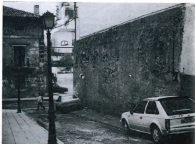
Todavía se puede observar el muro sobre el cual se edificó la casa que se destinó a Tolare y Sidrería (E).