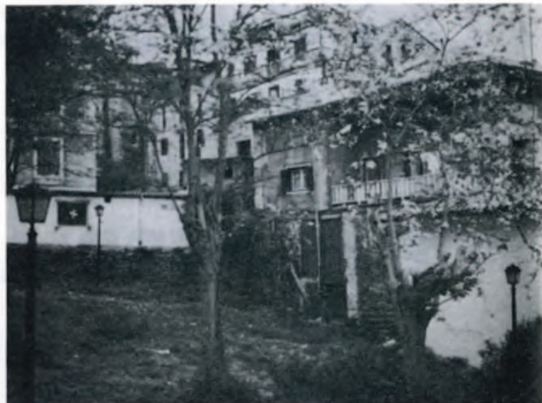
Vista del muro trasero de la casa de la cristalería (C) y la Sociedad Txepetxa, ocupando el lugar que antiguamente lo hizo la muralla.

I Aunque he podido saber que dicha casa perteneció a los Amasa y fue vendida a finales del siglo XVII a la familia Elizalde, procedente de la baja Navarra, cambiándose entonces el escudo anterior por el de Elizalde, escudo éste que se conserva en la actualidad.