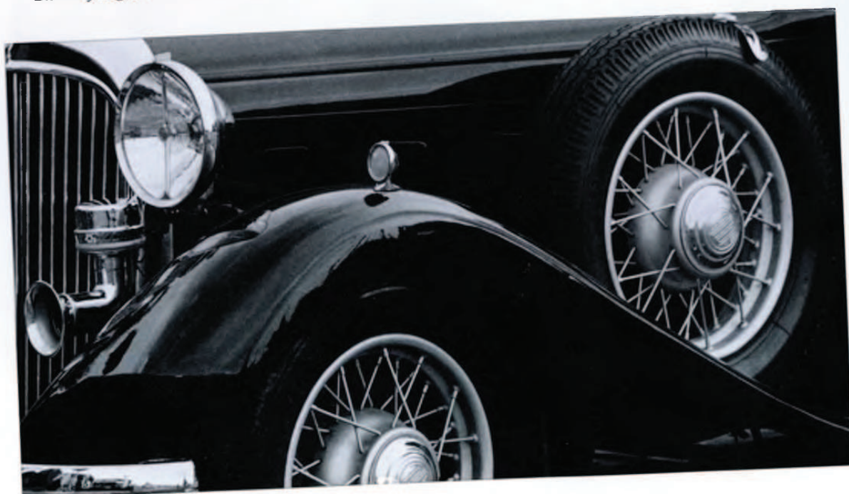
Titulo: Stop. Película Kodak 125 ASA. Papel ilford multigrado. Blanco y negro.