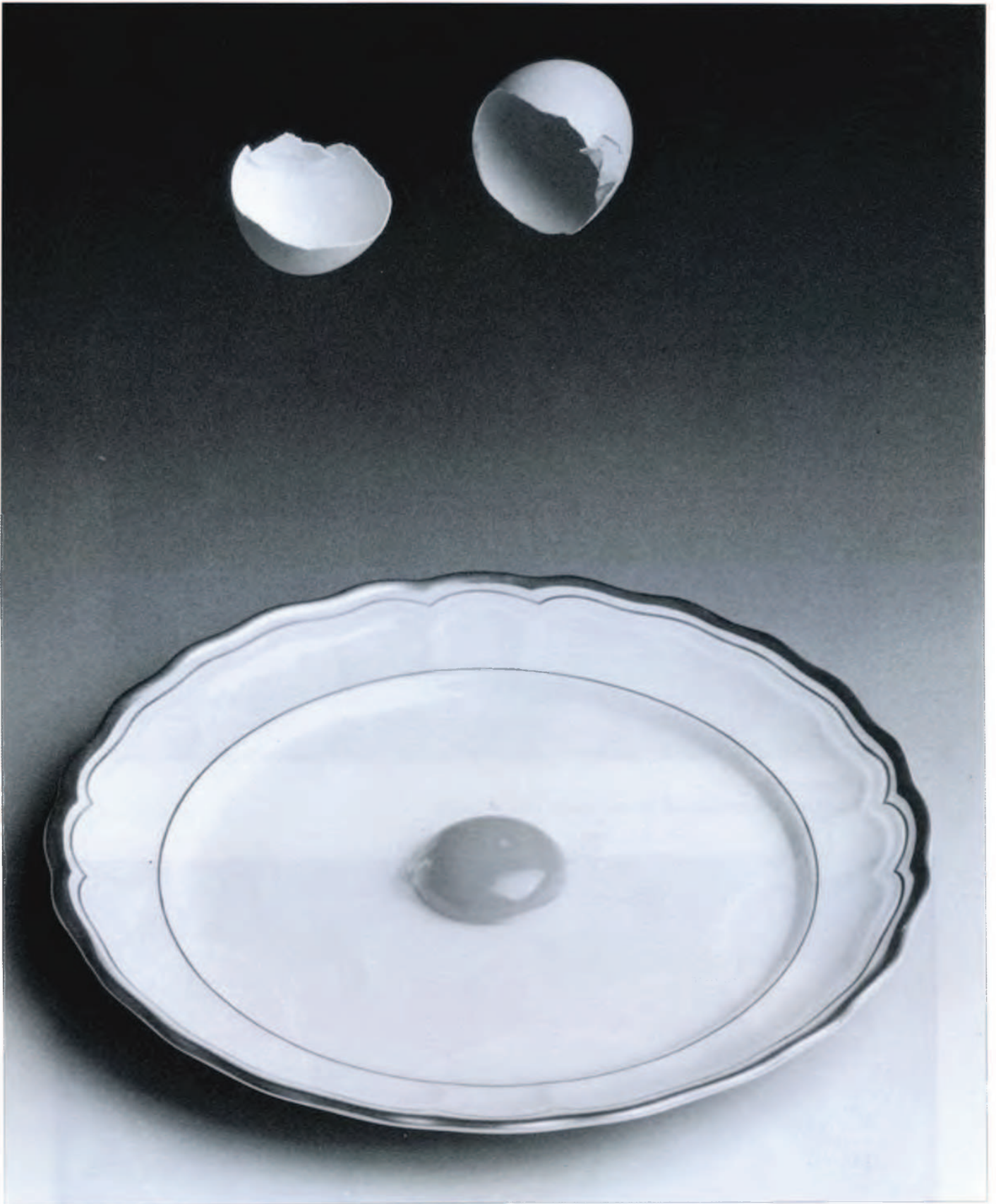
Titulo: Bodegón Película Kodak 100 ASA Negativo color. Realizada en estudio