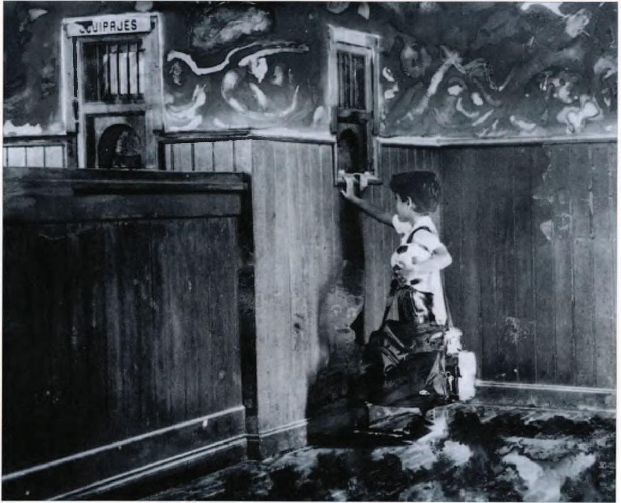
Título: Al cielo. Película Kodak 125 ASA B/N revelada sobre papel ilford y tratada con virajes químicos fotográficos.