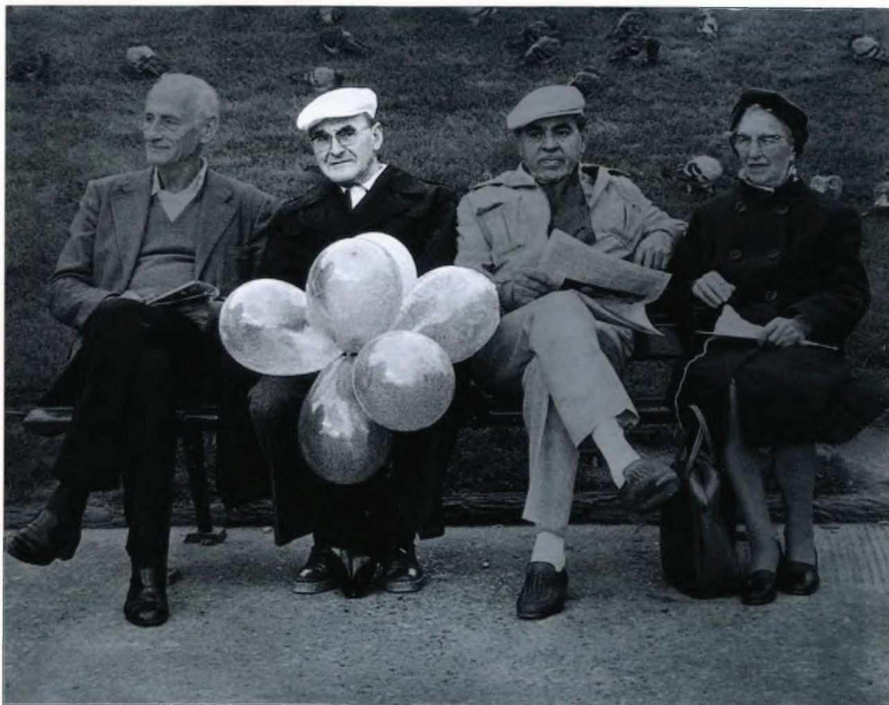
Titulo : La verdad. Solarización parcial realizada totalmente en cuarto oscuro. Película TRIX - 400 ASA

Wiesbaden - R.F.A. Plymouth - Gran Bretaña Trento - Italia Museo Vasco - Bayona Museo San Telmo Artefoto - Bilbao Museo Domec - Jerez S.F. Horta - Cataluña Aula cultura - Vitoria S.F. Guipúzcoa - San Sebastián