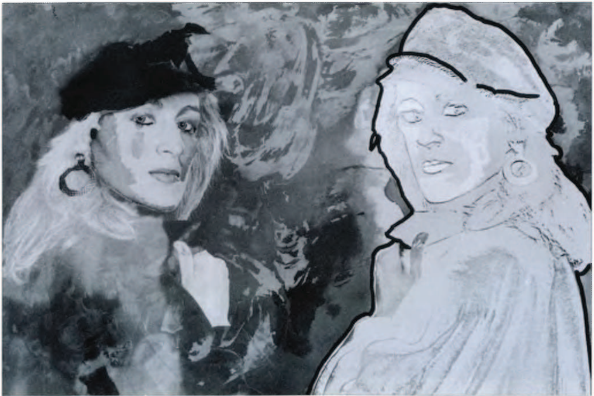
Título : Gemelas. Película Panaformic kodak 32 ASA. Blanco y negro doble exposición (lith) trabajada con virajes fotográficos.