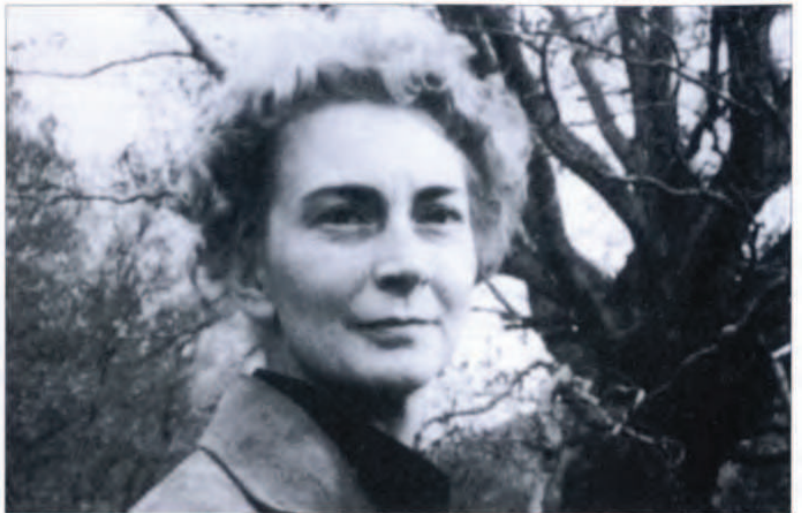
Andrée de Jongh, fundadora de "Comète", poco después de haber terminado la guerra mundial y haber sido liberada de los campos de concentración nazis.