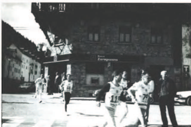
En las calles de Viella (28 de marzo de 1993)

Esta decisión de entrenar para pruebas combinadas la tomé tras haber vuelto al atletismo corriendo varias ediciones de la clásica Behobia-San Sebastián y después de haber hecho