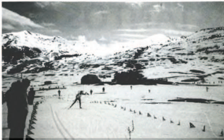
Viella, 28 de marzo de 1993