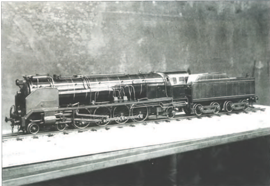
Santa Fe Lokomotora.

Oarso Aldizkariko Idazkari Lantaldearen gonbidapena jaso nuenean, bertan eta lantzeko beste gai batzuen artean, Oreretako Industriaren historia eta garapena azaltzen zen. Txikitan lantegi askoren inguruan bizi izandako eta ikusitako guztia etorri zitzaidan arrapaladan burura, baina batez ere aitona-amona, gurasoen eta beste senide batzuen etxeetan entzundakoa. Orduan esan nion neure buruari: Badaukat aurtengo aldizkarirako artikuloa!