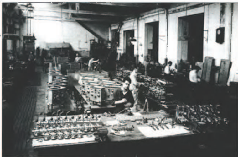
Cafeteras Omega Lantegia.

Ibilbide historiko-industrial honi bukaera ematen diot, batzuentzat beren haurtzarora eta gaztarora gogora ekartzeko balio izan duelakoan, eta beste batzuentzat gure herriaren historian lanak eta garapen industrialak gainditzeko zailak izango diren kotak eduki zituztenaren garaia imajinatzen balioko diela gogo eta itxaropenarekin.