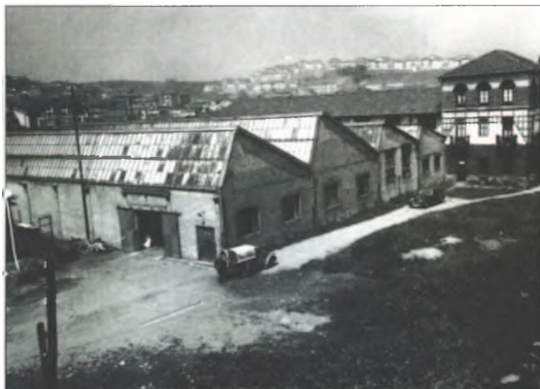
Cafeteras Omega, 1951.

Baina horretaz gain, lanera joaten zen eta da aurretik etxe-ko lanak egin ondoren. Izan ere, emakumearentzat bere lanaren bitartez bai berarentzat eta bai bere ingurukoentzat bizi-modua ateratzea harro izateko arrazoi nahikoa izan da beti.