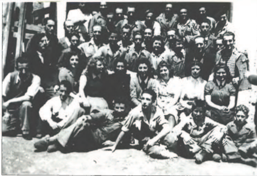
Cafeteras Omega-ko langileak. 1943ko ekaina.