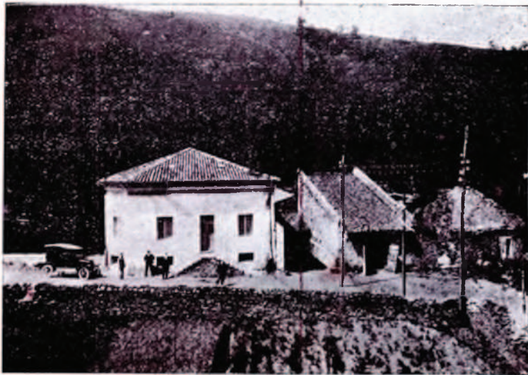
Vista exterior de la central de «Ereñozu» en Hernani

En la fotografía inserta se ve el motor, adqui-