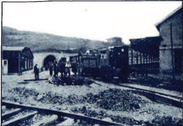
LA ANTIGUA CHARCA «LA PESQUERA» FÁBRICA DE PAPELES QUÍMICOS Y CONSTRUCCION DE FONDRES

¡Dichoso país el que puede contar en su seno hombres de esta envergadura!