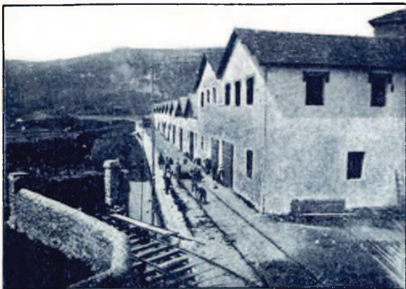
INDUSTRIAS VARIAS DE LA SOCIEDAD PROPIETARIA DE ALMACENES DE LEZO-PASAJES Y VIA DE APARTADERO SERVICIO DE LA REAL COMPAÑIA ASTURIANA

Otro proyecto surgido, al calor de esta actividad industrial es el de establecer manufacturas de pesca en Pasajes, y los productos elaborados encontrarán fácil salida y transporte económico.