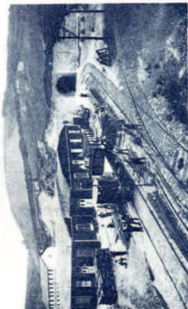
La antigua charca «La Pesquera». — Emplazamiento estación de Ieozo, del tranvía.