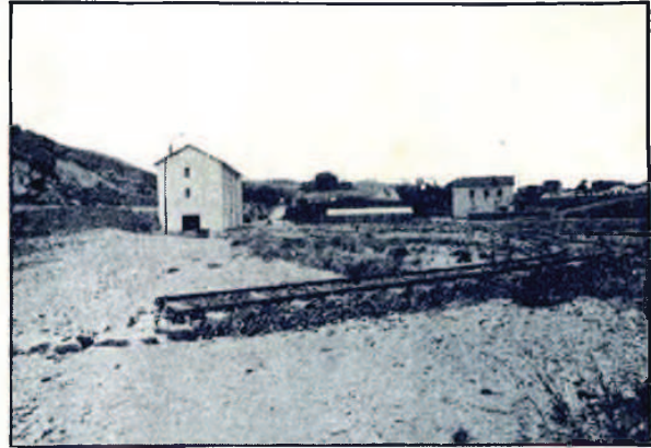
EMPLAZAMIENTO DE LOS TALLERES URCOLA

Dadas estas ventajosas condiciones se explica que todos los terrenos de que dispone la Sociedad estén ya ocupados;