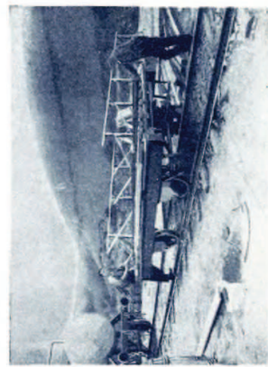
Emplazamiento talleres Urcola.