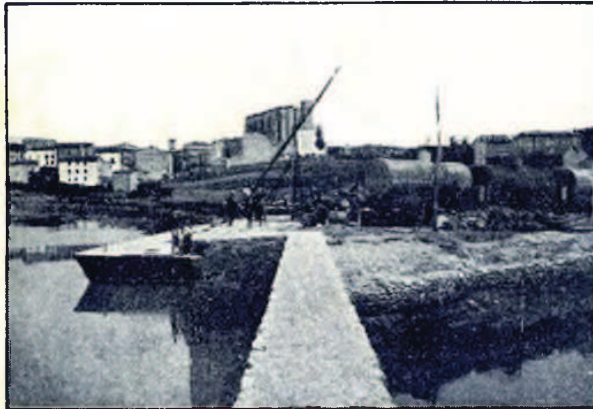
VISTA GENERAL DEL PUERTO DE LEZO, EN CONSTRUCCION

Rentería que gestiona cerca de la Compañía mejoras en la estación del Norte, habría de conseguir su deseo de un modo automático al aumentar el tráfico comercial, pues el