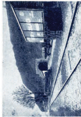
Apartadero estación empalme con la línea del Norte.