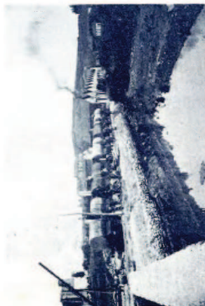
Vista general de los pabellones y muelles en construcción, propiedad de la Sociedad Almacenes de Ieozo-Pasajes.