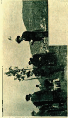
Un instante del "amaiketako" servido durante la excursión.