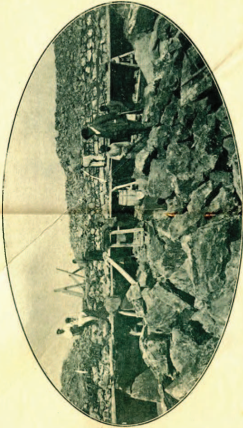
Obras del Depósito regulador, en período de ejecución.