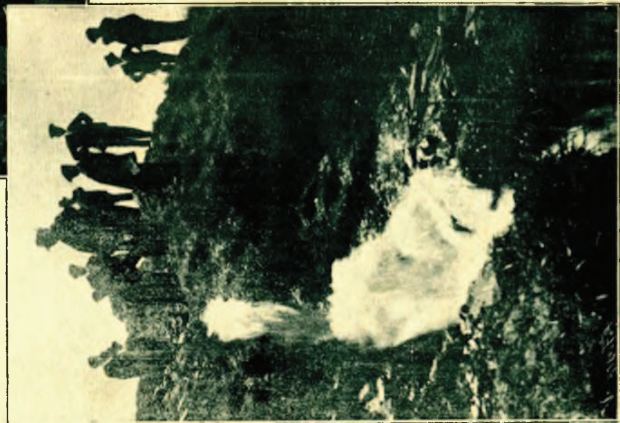
Desagüe provisional de la conducción, durante las obras del Depósito regulador.