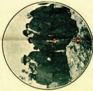
Las autoridades de la Villa, examinando la llegada del agua en una cabeza de sifón.