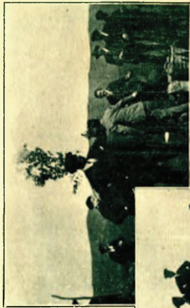
El fotógrafo sorprende a los invitados "haciendo por la vida".