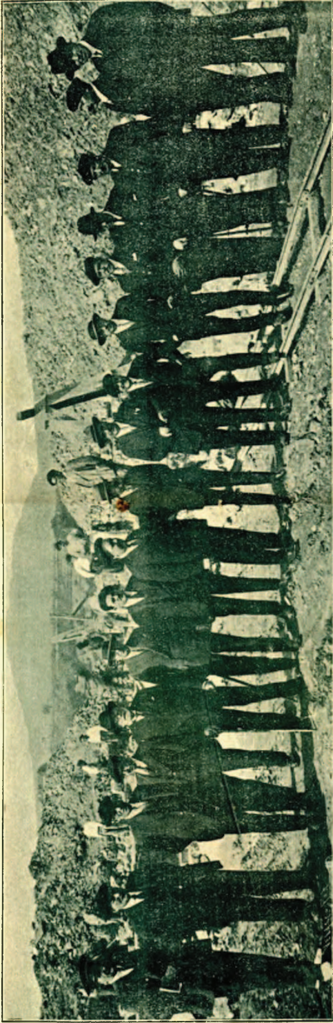
El Ayuntamiento en pleno, en el emplazamiento del Depósito regulador de 1.500.000 litros de capacidad.