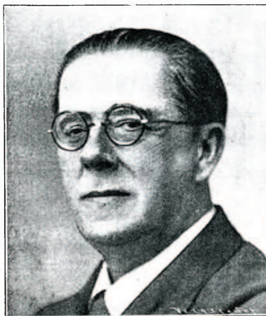
Es don Manuel Becerra, subsecretario de Obras Públicas en la actualidad, hombre que, desde su alta significación política, ha puesto siempre un gran interés por cuanto a nuestra Villa se refiera. En el asunto de las obras para conjurar el peligro de nuevas inundaciones, él ha figurado siempre en primera línea cuando de dar eficaz impulso a la tramitación del proyecto se trataba.