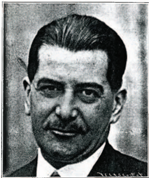
Don Rafael Guerra del Río, cuando fué ministro de Obras Públicas, mostró un extraordinario deseo de poner remedio definitivo al constante peligro de las avenidas del río Oyozun. De la época en que era ministro este prohombre radical datan los primeros trabajos serios encaminados a evitar la repetición de tales desdichas. La Villa le guarda sincero reconocimiento.