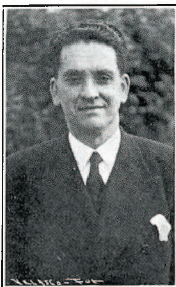
D. Manuel de Irujo