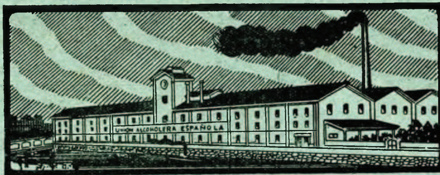
FABRICA DE LEZO-RENTERIA

Grandes fábricas de levadura prensada para panificación y seca para panificación y piensos, marca «DANUBIO».