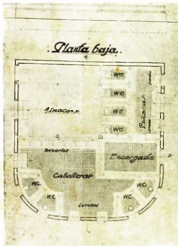
En la parte baja del mismo quedarán instalados varios servicios y dependencias municipales, según la disposición que podrá apreciar el lector por el presente croquis

Nos complace mucho poder dar en nuestro número de este año noticia de estas obras, que por referirse a la Alameda de Gamón, centro del esparcimiento popular de Rentería, tanta relación guardan también con nuestra fiesta de la Magdalena.