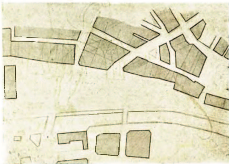
Disposición que tendrán las partes de la Villa afectadas por las importantes obras hoy en curso, una vez que éstas se-realicen

Una vez realizadas estas reformas, que ligeramente acabamos de reseñar, adoptará la Alameda de Gamón la forma de un trapecio con 45 metros de anchura en su base y 25 en el otro extremo lindante con la calle Viteri.