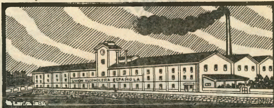
FABRICA DE LEZO - RENTERIA

Grandes fábricas de levadura prensada para panificación y seca para panificación y piensos, marca «DANUBIO»