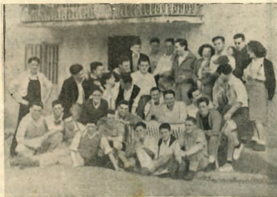
! Marcha social.--Los montañeros hacen un alto en la Venta de Arlepo

Animarse, muchachos; que es muy bonito ver deslizar la nieve bajo las botas, mientras la mirada, clavada en la lejanía, no cesa de buscar una meta imaginaria, y encontrarse, de pronto, con un respa-