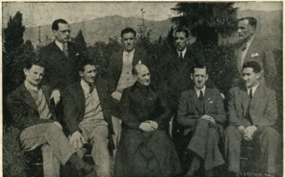
Director y cantores del ochote renteriano "Oarso"

Nos dicen todo esto muy bajito, para que D. Bautista, que está muy ocupado en hacer cantar un doble fa sostenido a un ochotista, no les haga callar al sentir herida su habitual modestia.