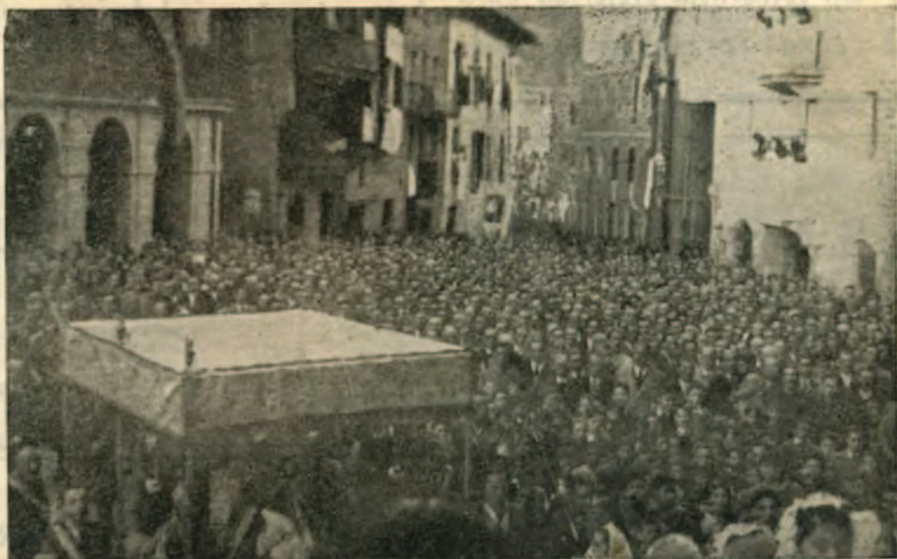
El Santísimo, tras de ser paseado por las calles de la Villa, seguido de un verdadero océano de fieles

El joven artista renteriano Félix Lavilla, a cuyo