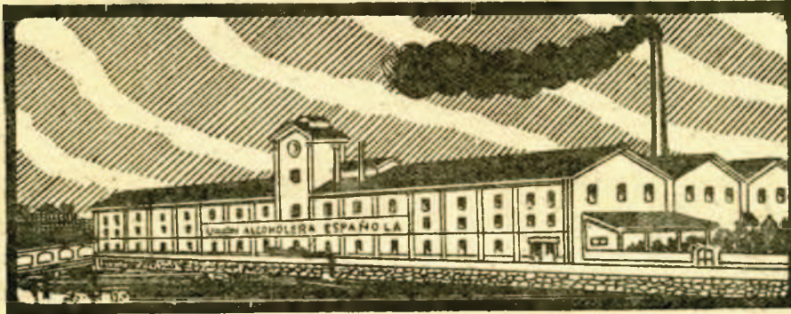
FABRICA DE LEZO-RENTERIA

Grandes fábricas de levadura prensada para panificación y seca para panificación y piensos, marca «DANUBIO»