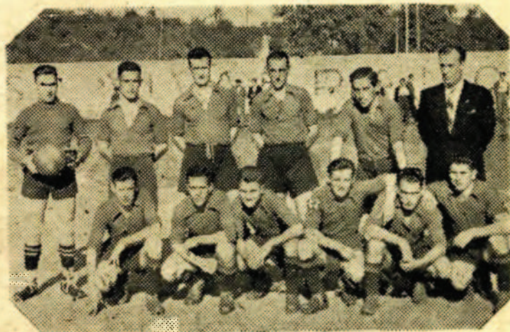
Nuestro imponderable «Touring», flor y nata del balompié renteriano