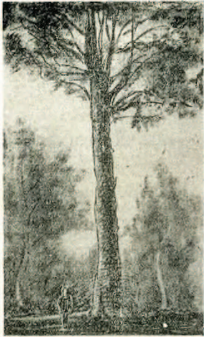
(Dibujo del artista renteriano Felipe Gurruchaga)

minarse. Y hasta el más profano observa grandes zonas ya limpias, que se han remozado y rejuvenecido, presentando un aspecto magnífico y augurando un gran porvenir. Y aunque todavía se observan claros por esta poda reciente, se irán cubriendo con los nuevos brotes y desarrollo de las plantas jóvenes, hasta quedar un bosque espeso y bien aprovechado en toda su integridad, que de aquí a pocos años representará para el pueblo de Rentería una riqueza incalculable.