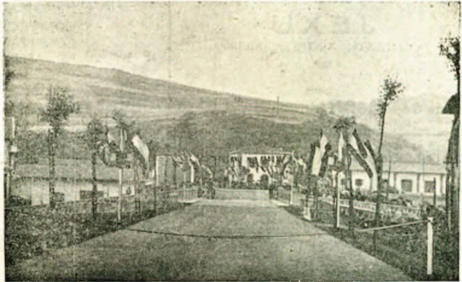
El puente sobre el Oyarzun, inaugurado el 21 de Mayo ultimo.

Esta obra, juntamente con las que están pro-