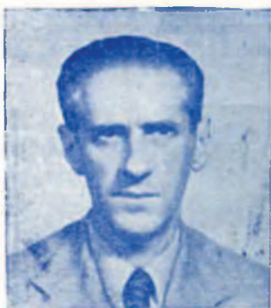
Uno de los últimos retratos del popular artista renteriano