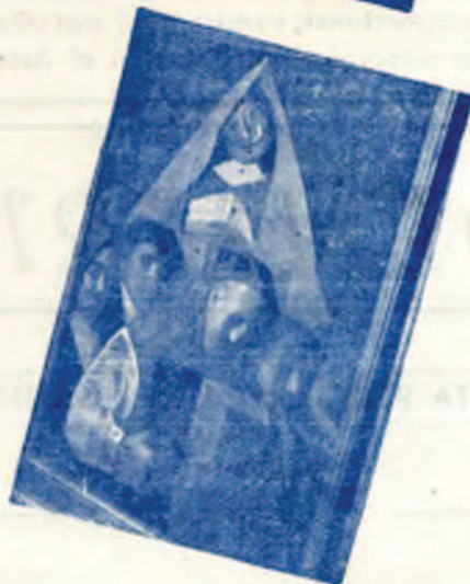
«Mi madre» y «Refrescando» (Pascua); «Dos amigas» y «Danza de los periquitos» (Cobrerros); «Rosas» (Pepita Rodriguez) y «Olentzero» (Valverde).