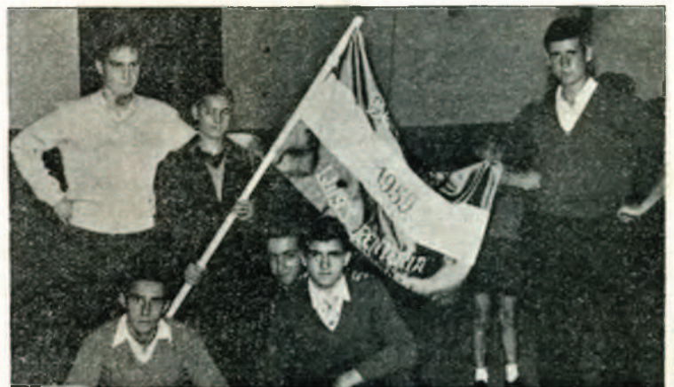
El patrón del batel ganador de la regata luce, lleno de sana satisfacción deportiva, la bandera ofrecida a los vencedores por la Congregación.