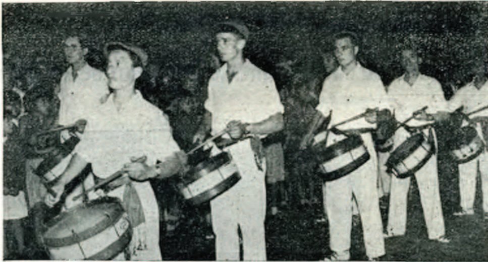
Un detalle del desfile de la Tamborrada, celebrada durante la noche del sábado 20 de Junio.

bar directamente las condiciones que para el arte de Talis poseían los "Luises" renterianos.