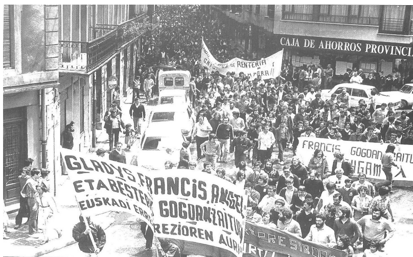
Fotografía: Egin, 13/07/1979.

Según testigos que se encontraban en la discoteca Apolo, la víctima, natural de Jaén, salió en defensa del buen nombre de los vascos cuando el agresor lanzó supuestos improperios y amenazas de querer matar a "algún vasco". Al parecer, el policía se encontraba en Errenteria en periodo de prueba. El rechazo por esta nueva muerte fue inmediato.