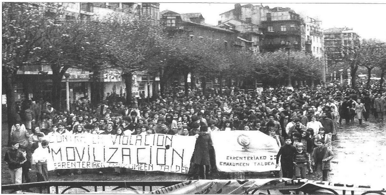
Orereta (1976-1983), p. 96.

Fuente: Víctimas de vulneraciones de derechos humanos derivadas de la violencia de motivación política. Dirección de Derechos Humanos del Gobierno vasco, junio de 2008, pp. 482 a 484.