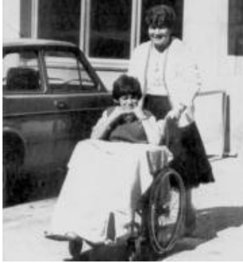
Fotografía: ABC Hemeroteca, 23/02/2001