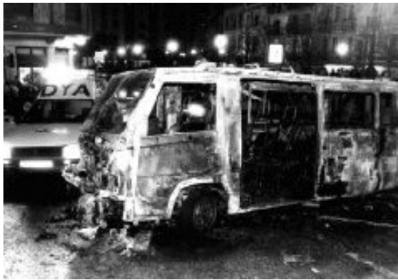
Argazkia: EFE, El Correo.com , 2004/10/22.

Bost ertzainen etxebizitzaren aurkako erasoak, kalez jantzitako bi agente kolpatuak, ertzainen 7 ibilgailu partikular erreak, molotov koktelek egindako 31 eraso Ertzaintzaren patruila-autoen kontra eta 3 eraso polizia-etxearen kontra. Ertzainek Errenterian jasandako erasoaren balantzearen zati bat baino ez da hori, manifestazioetan eta greba-egunetan izandako istiluak ez baitira kontuan hartu. 1997ko apirilaren 28an, gainera, ETak Ertzaintzaren polizia-etxearen ondoan 30 kilo amosal eta 10 kilo torlojurekin aparkatuta utzitako bonba-auto batek huts egin zuen Ertzaintzaren furgoneta bat bertatik pasatzean. Hala ere, geroago bonba-autoa era kontrolatuan detonatzean, 50 etxebizitzak eta 20 ibilgailuk kalteak izan zituzten, eta Miguel Alduntzin kaleko ehun herritarrek beren etxetik kanpo eman behar izan zuten gaua.