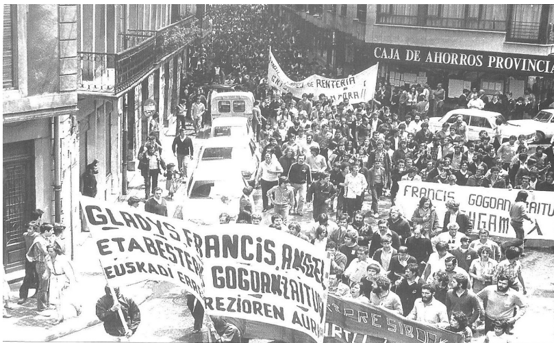
Argazkia: Egin , 1979/07/13.

Apolo dantzalekuan zeuden lekuko arabera, biktima -Jaenen jaioa- euskaldunen izen onaren alde agertu zen erasotzailea euskaldunak iraintzen eta "euskaldunen bat" hiltzeko mehatxuka hasi zenean. Dirudienez, polizia probaldian zegoen Erreterian. Hilketaren kontrako protesta berehalakoa izan zen.