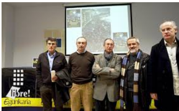
Argazkia: "Egunkaria libre". Oleaga, ezkerretik bigarrena.

El País egunkariak 2013ko otsailaren 9an argitaratu zuen "Rentería, símbolo ahora de la paz" erreportajea, herriak "tortura-salaketan errekorra" zuela aipatzen zen.