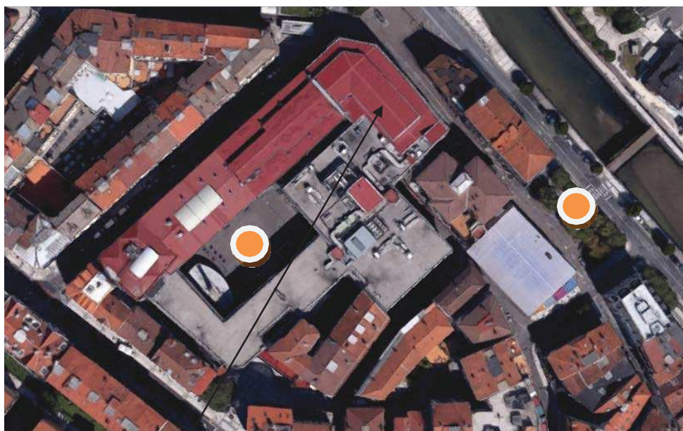
GIMNASIOA (2.SOLAIRUA) / GIMNASIO (2ª PLANTA)